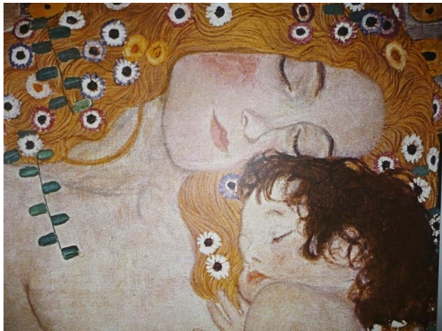
Gustav Klimts Wandbild „Mutter und Kind“ ziert unser Still- und Besprechungszimmer.

Beim Thema „Stillen“ helfen wir Euch gern ausführlicher im Mittendrin weiter: